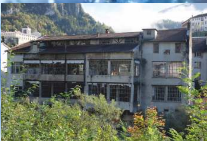
Démolition en cours de la friche Emboutissage Jurassien dans le cadre du réaménagement et de la renaturation des berges de la Bienne au Faubourg Marcel.