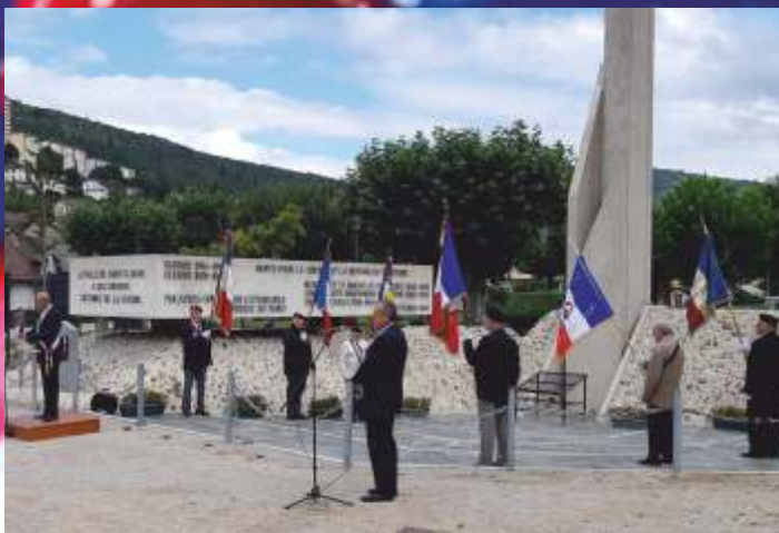
Commémoration du 75 ème anniversaire de la Libération de la ville, lundi 2 septembre.