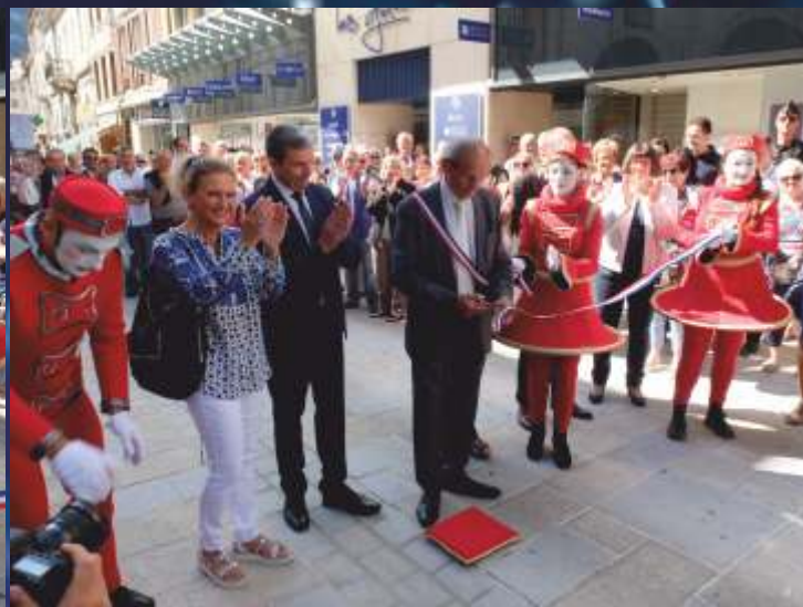
Journée festive du 14 septembre pour remercier les habitants de Saint-Claude et les commerçants de leur patience pendant ces neuf mois de travaux de requalification du centre-ville.