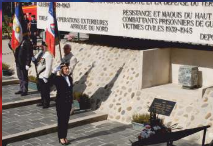
Cérémonie de prise de fonction de Virginie Martinez, sous-préfète de Saint-Claude, le lundi 16 septembre.