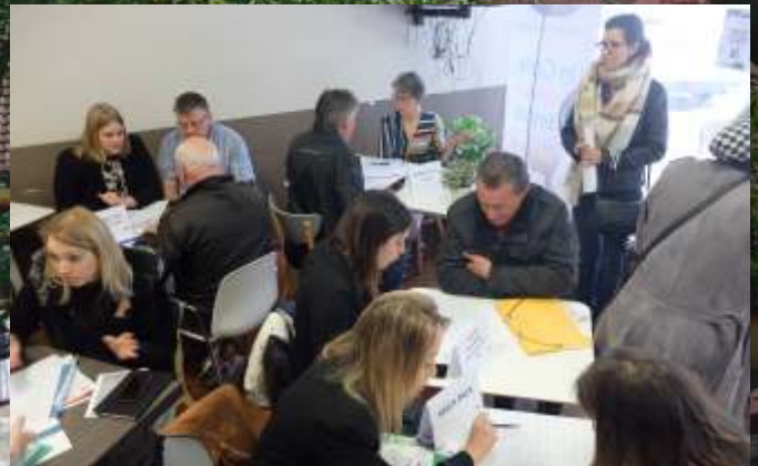
Premier Café Contact de l'Emploi à Saint-Claude, jeudi 6 juin au bar Le Chabot.