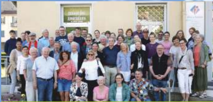
40 ans de partenariat entre Saint-Claude et Rottenburg am Neckar ont été célébrés par les Sanclaudiens et les Allemands, du 30 mai au 2 juin à Saint-Claude (cf. page 11)