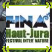
Franc succès pour la première édition du Festival Inter'Nature du Haut-Jura, les 12, 13 et 14 avril derniers.