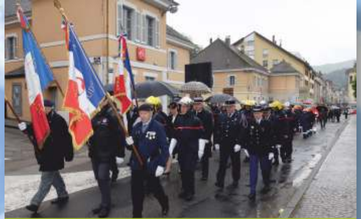
Commémoration du 74 ème anniversaire de la Victoire du 8 mai 1945.