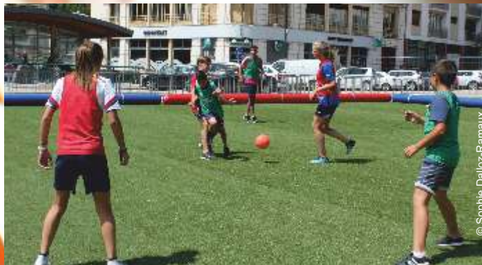
Animations sportives lors de la Semaine du Sport , du 3 au 6 juillet sur la Place du 9 avril 1944.