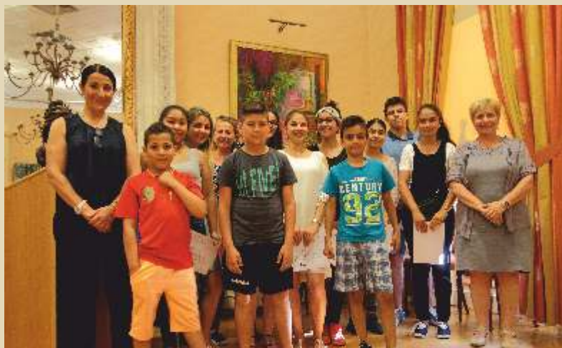
Cérémonie de remise des attestations aux tuteurs du dispositif CRE, jeudi 28 juin.

C'est un accompagnement individuel destiné à des jeunes de quatre à seize ans, scolarisés ou non, résidants sur la commune de Saint-Claude et qui présentent des signes de fragilité ou des difficultés dans les domaines éducatif, social ou familial.