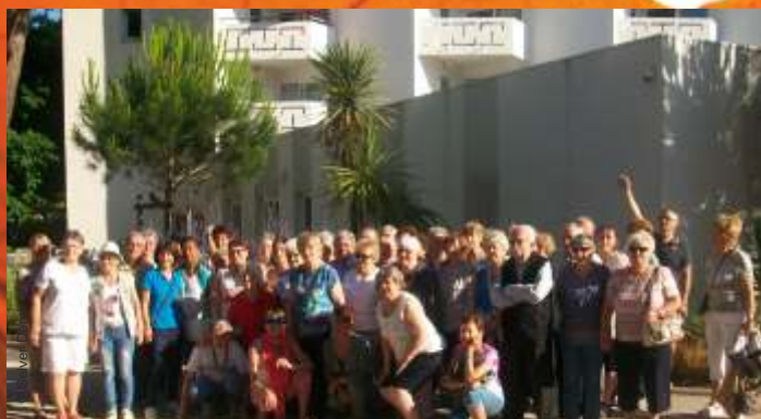
Voyage organisé pour les seniors en juin à La Grande-Motte par le Centre Communal d'Action Sociale de Saint-Claude.