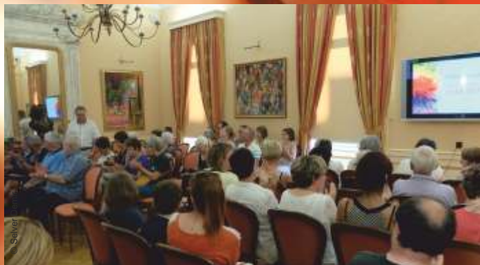
Franc succès pour la présentation officielle de la saison culturelle 2018-2019 .