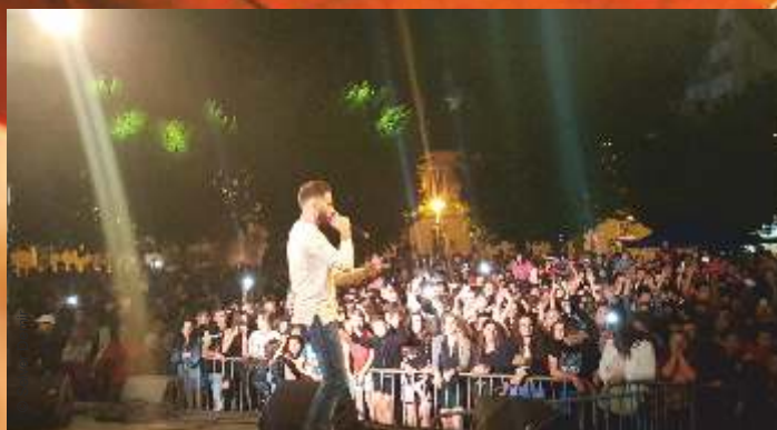
Près de 4 500 personnes étaient présentes au concert de Ridsa et dans les rues du centre-ville pour la Fête de la Musique à Saint-Claude , le vendredi 22 juin.