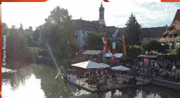
Week-end festif lors de la Fête du Neckar , les 23 et 24 juin à Rottenburg am Neckar (Allemagne).