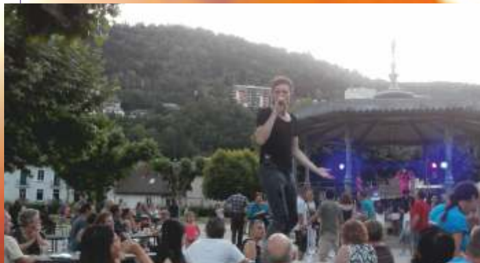
Une belle soirée animée pour clôturer la Fête des quartiers au Parc du Truchet, le samedi 30 juin.