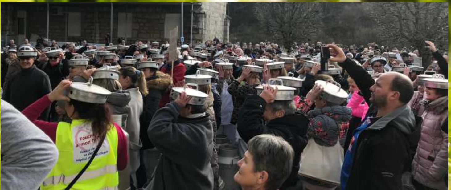
Rassemblement en soutien pour la sauvegarde de l'hôpital , le mercredi 24 janvier.