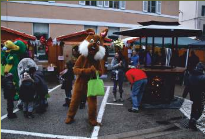
Le marché de Noël a pris place le temps de deux week-ends sur le parking Lamartine en décembre dernier.