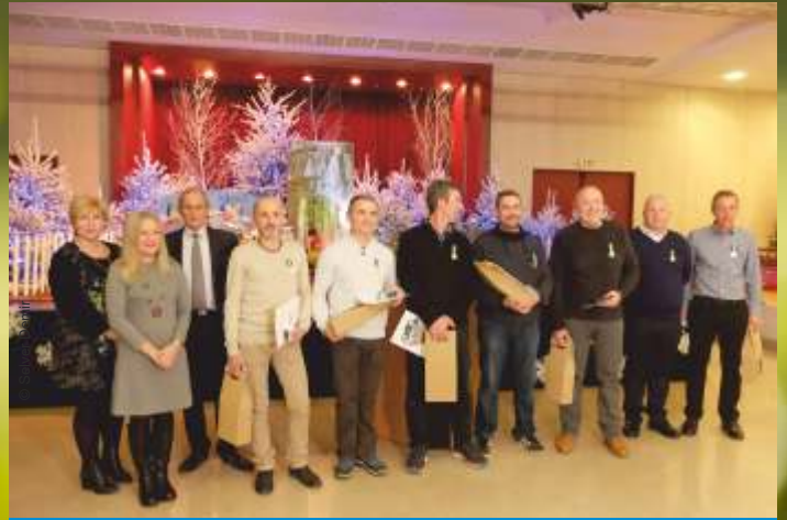
Remise des médailles d'honneur aux agents par la Municipalité, à l'occasion de la présentation des vœux au personnel le mercredi 10 janvier.