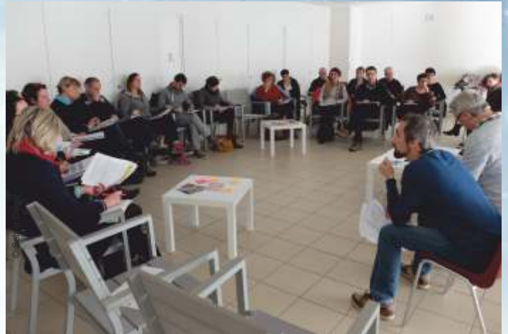
Lancement de l' appel à projets Politique de la Ville 2018 le 16 novembre dernier.