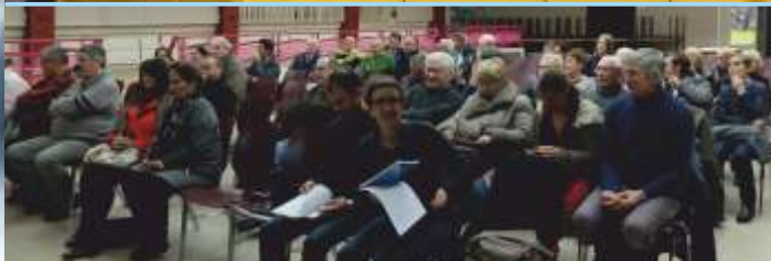
Une cinquantaine de personnes sont venues échanger au sujet de la réhabilitation des berges de la Bienne au faubourg Marcel lors de la réunion publique du 20 novembre .