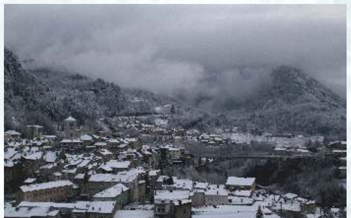
La ville se pare de son manteau de neige pour l'hiver...