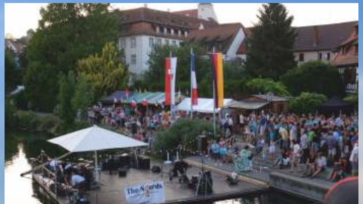
Saint-Claude était représentée lors de la Fête du Neckar à Rottenburg (Allemagne), les 24 et 25 juin derniers.