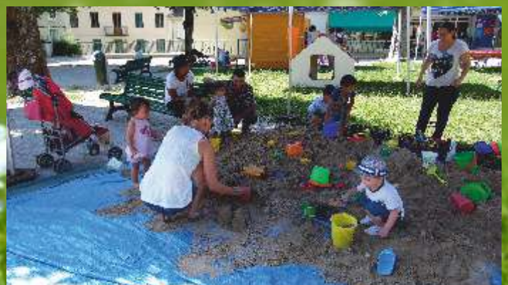
Petits et grands ont participé à Fête de la Maison de la Petite Enfance organisée le 6 juillet.