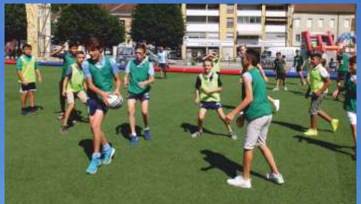
Initiation rugby pour les participants de la Semaine du Sport qui s'est déroulée du 4 au 7 juillet derniers.