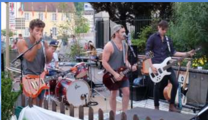
Ambiance rock avec le groupe « Red Sparks » au bar « Chez Maurice » lors de la Fête de la musique le 21 juin.