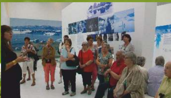
Visite guidée du nouveau Musée polaire Paul-Émile Victor à Prémamanon pour les participants des ateliers mémoire le 7 juillet.