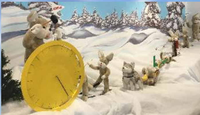
Le Monde des Automates a ouvert ses portes le samedi 1 er juillet, Place Jacques Faizant.