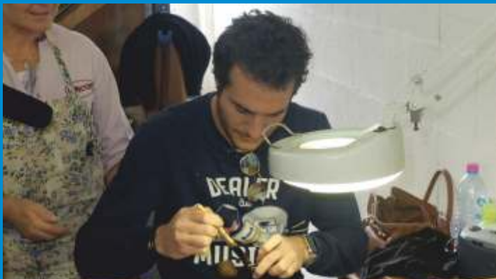
Le chanteur Amir visite le fabricant de pipes Chacom lors de son passage à Saint-Claude, le jeudi 18 mai.