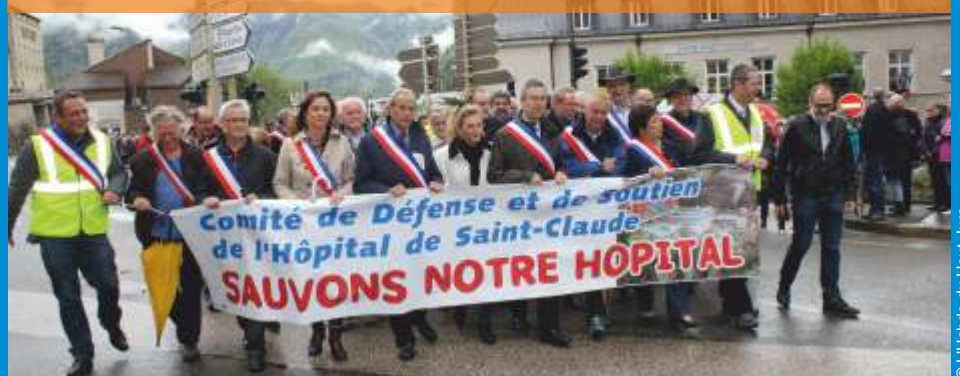
Les Haut-Jurassiens se sont mobilisés lors d'une manifestation qui a rassemblé entre 3 500 et 5 000 personnes en soutien pour la sauvegarde de l'hôpital de Saint-Claude , le samedi 13 mai.