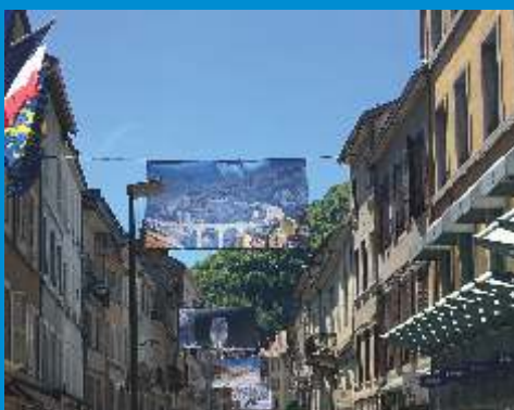
La ville se pare de nouvelles couleurs avec des photographies grandeur nature visibles dans les rues du centre-ville.