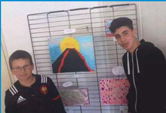
Vernissage des œuvres réalisées par les jeunes du Centre Aventure ados pendant les vacances de printemps, le vendredi 28 avril.