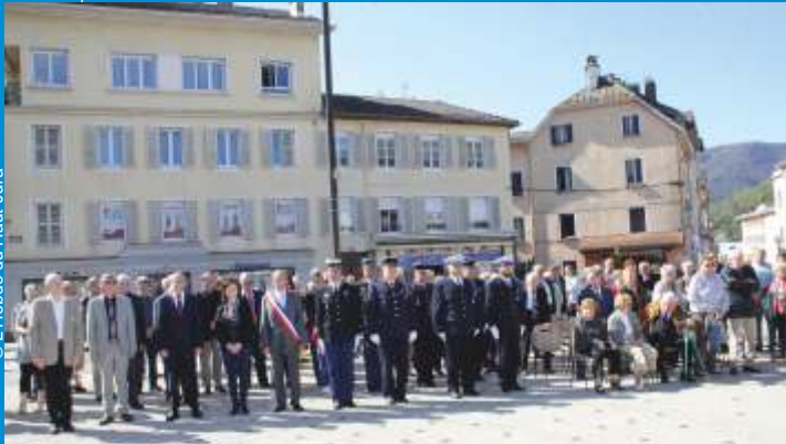
Commémoration de la rafle de Pâques 1944, le dimanche 9 avril.