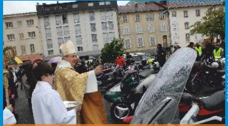
Premier Festival Mot'Haut-Jura organisé à Saint-Claude , les 6 et 7 mai.