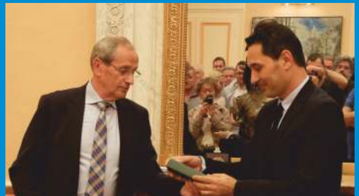
Remise de la médaille d'honneur de la Ville à Salem ATTALAH , Arbitre de rugby du Top 14, le jeudi 30 mars.