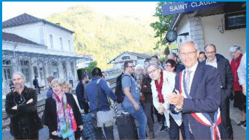
Manifestation du vendredi 5 mai pour le maintien de la ligne ferroviaire Saint-Claude/Oyonnax.