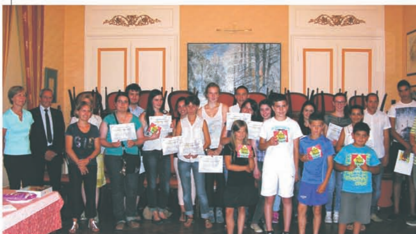
Cérémonie de remise des attestations de tutorat, le jeudi 3 juillet en Salle d'Honneur de l'Hôtel de Ville.