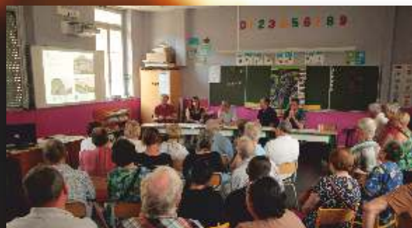
Réunion de quartier dans le cadre de la réhabilitation des berges de la Bienne au Faubourg Marcel , lundi 8 juillet.