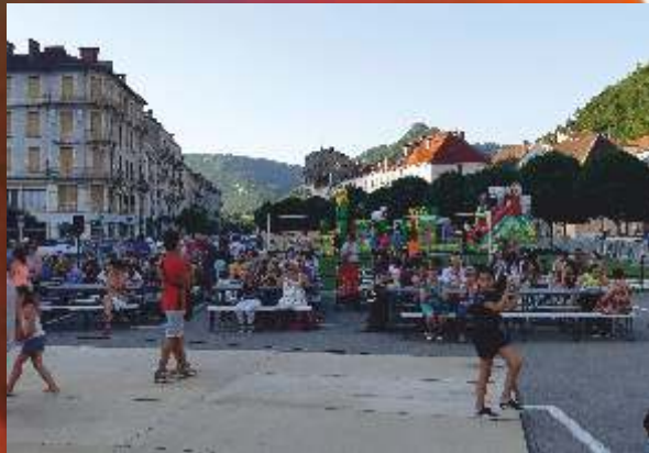
7 ème édition de la Semaine du Sport , du 2 au 5 juillet et remise des Trophées des Champions , vendredi 5 juillet, sur la Place du 9 avril 1944.