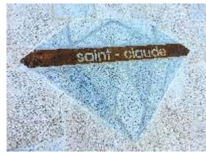
Diamant en granit situé sur le parvis de l'Hôtel de Ville

La Ville remercie une nouvelle fois l'ensemble des usagers (riverains, professionnels, visiteurs...) pour leur patience et leur compréhension tout au long de ces travaux qui se finalisent, pour le plus grand plaisir de tous, avec la pose du mobilier urbain. Vos nombreuses réactions et messages de satisfaction prouvent que ces travaux étaient attendus. Chacun peut aujourd'hui profiter de cet espace public requalifié. Merci à tous d'en prendre soin.