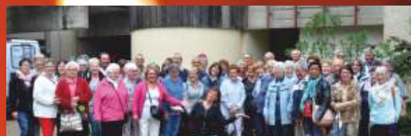
Les seniors en vacances avec le Centre Communal d'Action Sociale , du 8 au 15 juin à Vernet-les-Bains (Pyrénées-Orientales).