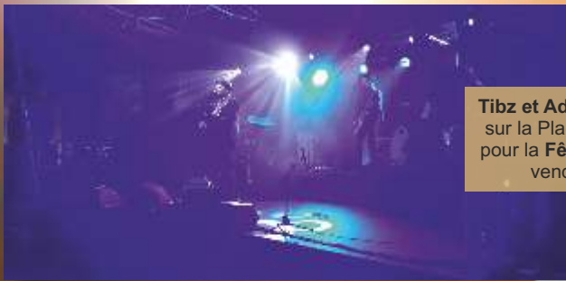
Tibz et Adryano en concert sur la Place du 9 avril 1944 pour la Fête de la Musique , vendredi 21 juin.