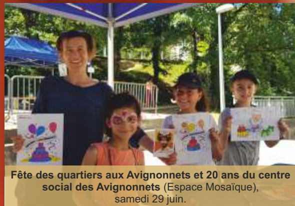
Fête des quartiers aux Avignonnets et 20 ans du centre social des Avignonnets (Espace Mosaïque), samedi 29 juin.