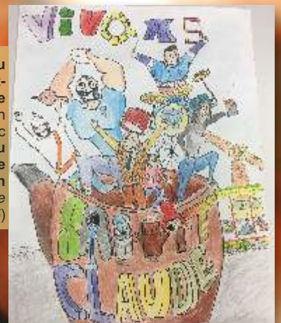
Les élèves de 3 ème du Collège du Pré Saint-Sauveur ont réalisé une affiche dans le cadre d'un projet scolaire en lien avec la requalification du centre-ville et l'étude de revitalisation (cf. Saint-Claude Magazine n°74, page 5)