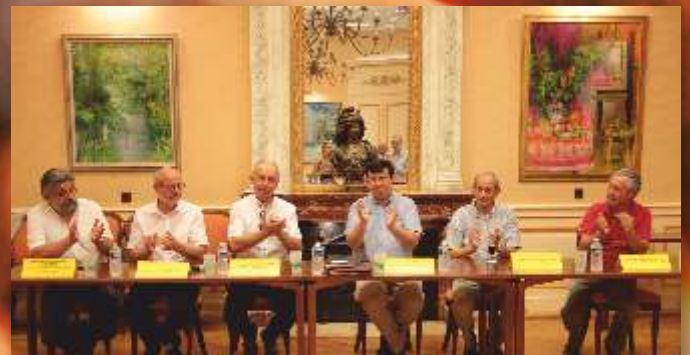
Signature des Conventions de Revitalisation Saint-Claude/Lavans-lès-Saint-Claude/Coteaux du Lizon , lundi 8 juillet.