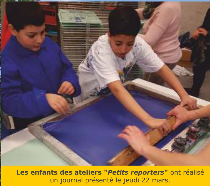
Les enfants des ateliers "Petits reporters" ont réalisé un journal présenté le jeudi 22 mars.