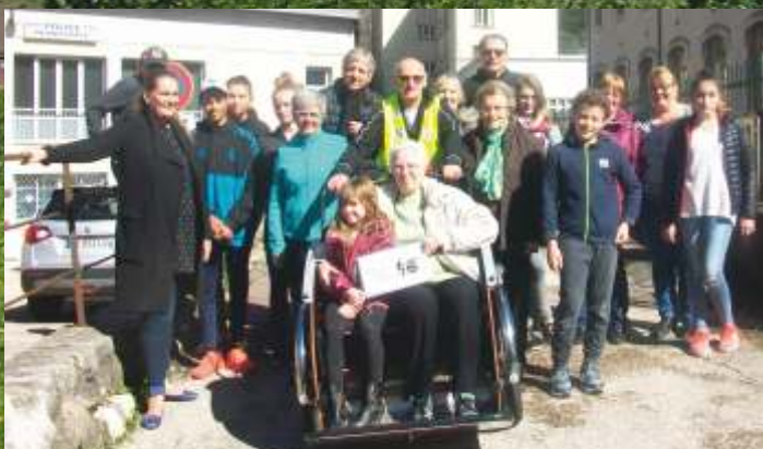
Présentation du triporteur par l'association « À vélo sans âge » et balade avec les jeunes du Centre Aventure ados et les adhérents du Centre Communal d'Action Sociale de Saint-Claude pendant les vacances de février.