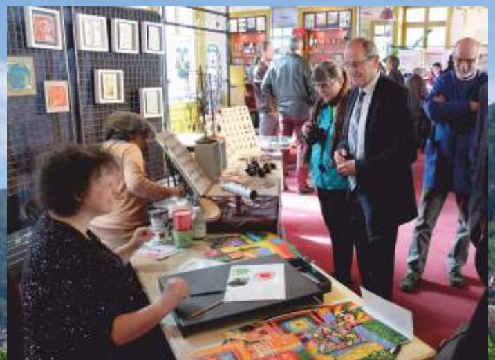
Week-end d'exception à l'occasion des Journées Européennes des Métiers d'Art du Haut-Jura, les 7 et 8 avril derniers.